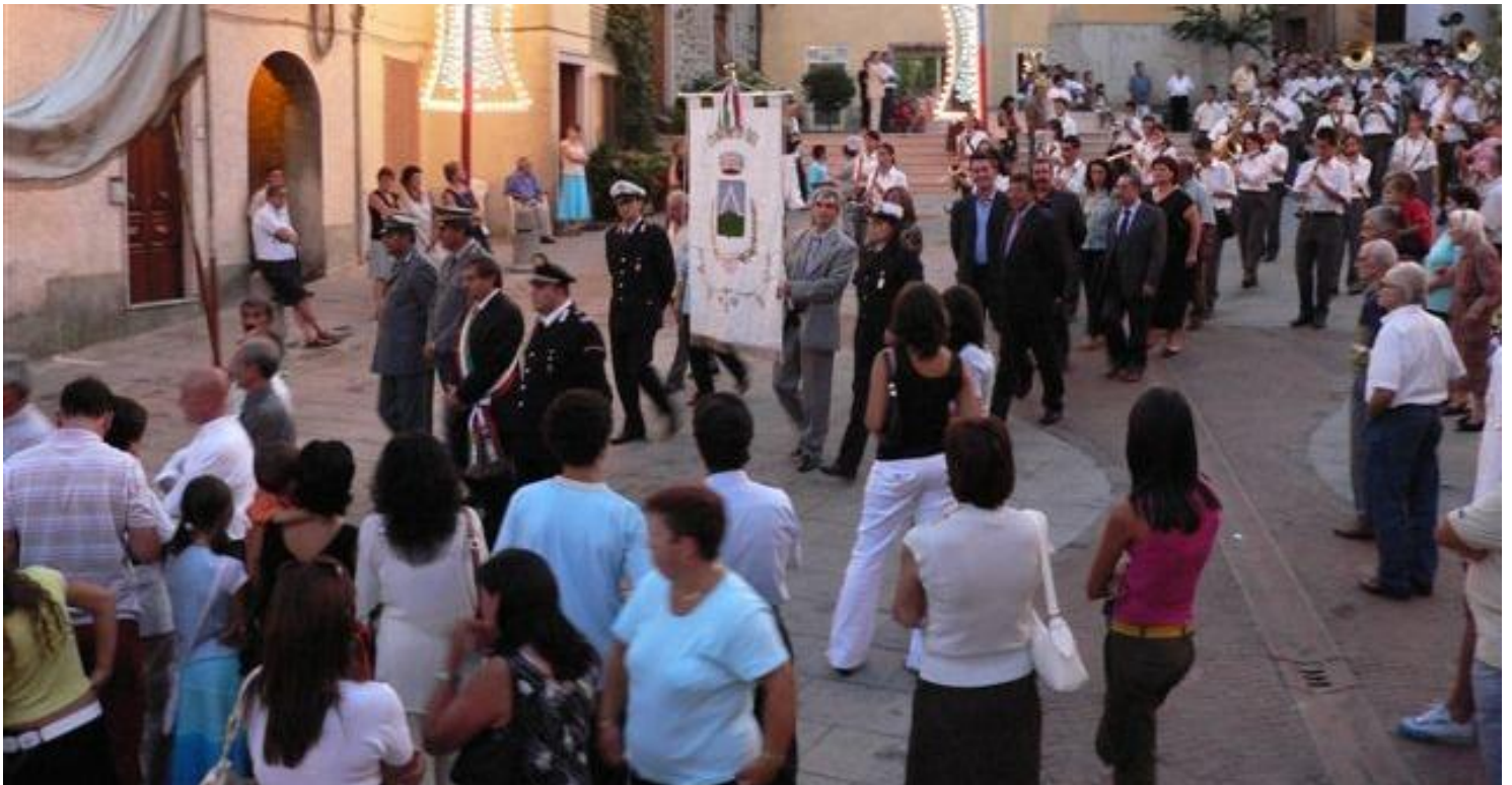
GIOI—AGOSTO 2006. PROCESSIONE DI SAN NICOLA.